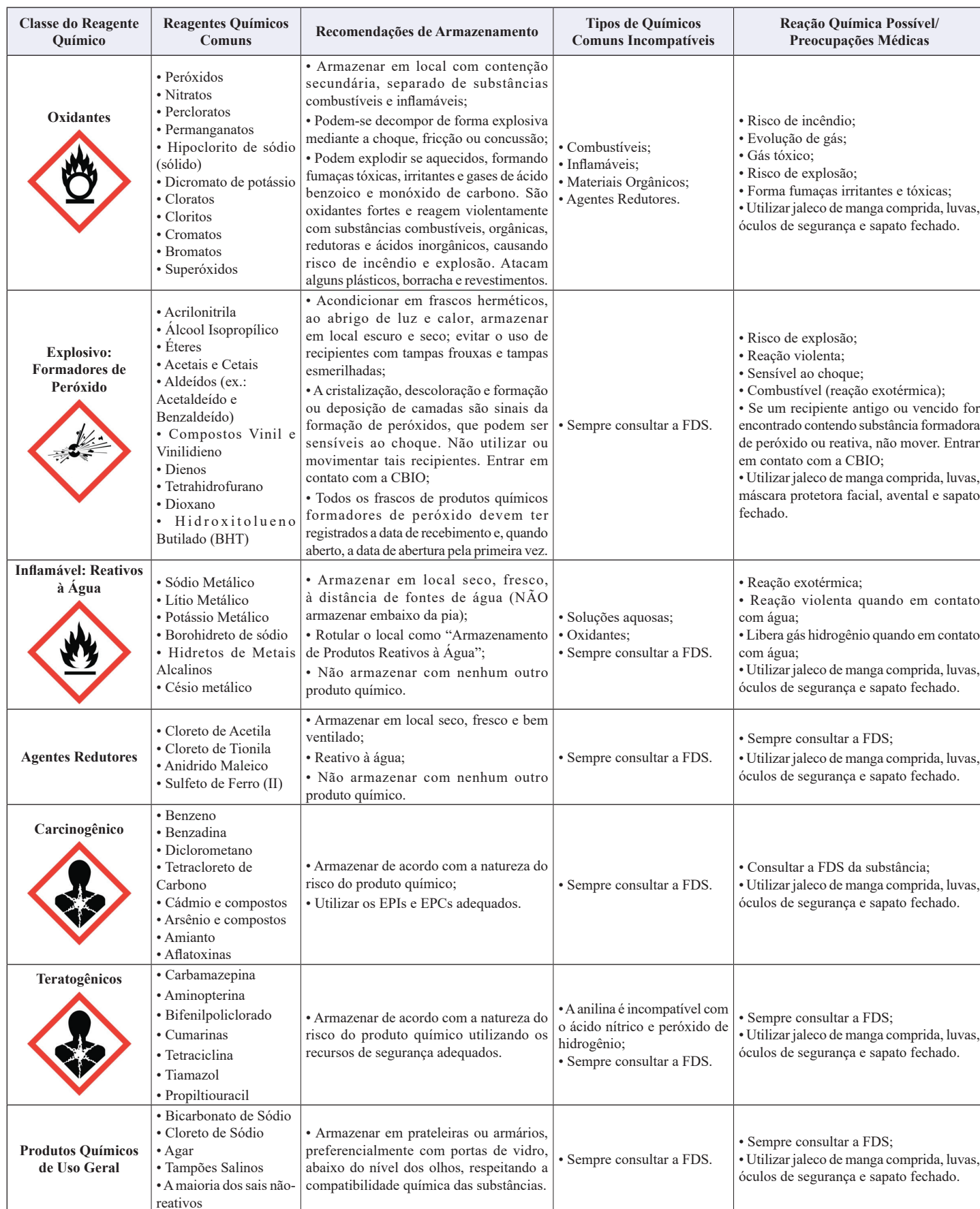
TABELA 1 - Tabela de Compatibilidade Química. - Fonte: U.S. DEPARTMENT OF HEALTH & HUMAN SERVICES. Chemical Safety Guide. 5ª edição, Bethesda, MARYLAND, U.S.A. Disponível em: < https://ors.od.nih.gov/sr/dohs/Documents/chemical-safety-guide.pdf >. Acessado em: 2 de fevereiro de 2024.